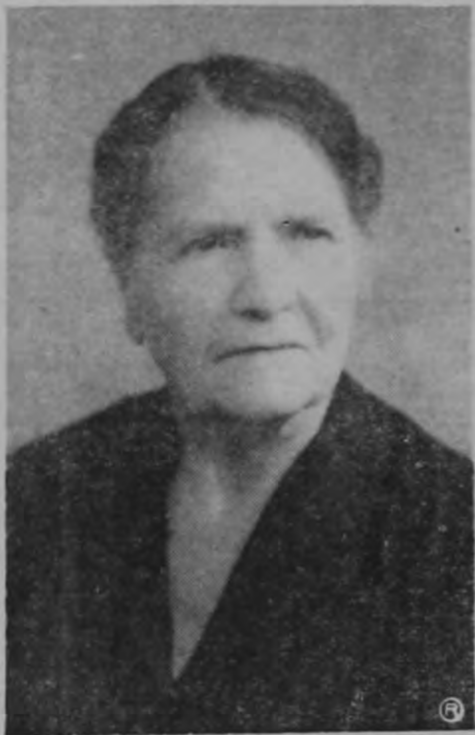
Nada turba su fin: es la noche de un hermoso día. La Fontaine